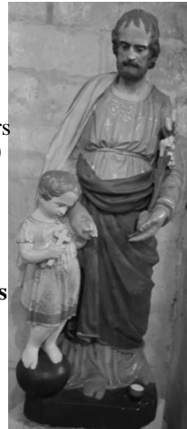
Saint Joseph église N-D Chauvigny

Samedi 19 Chauvigny 10h30 : Confessions (Notre-Dame) Jardres 11h : Messe