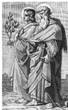
Saints Philippe & Jacques