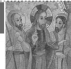
CATÉCHÈSE POUR ADULTES

Chauvigny Presbytère 20h30 : Equipe pastorale