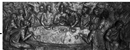
La Cène : Autel N-D Chauvigny

Bonnes 8h : Laudes La Puye EHPAD 15h : Messe en mémoire de la Cène du Seigneur Chauvigny Notre-Dame 19 h : Messe en mémoire de la Cène du Seigneur et Adoration