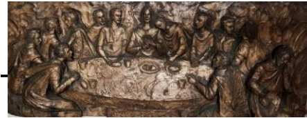
La Cène : Autel N-D Chauvigny

Bonnes 8h : Laudes La Puye EHPAD 15h : Messe en mémoire de la Cène du Seigneur Chauvigny Notre-Dame 19h : Messe en mémoire de la Cène du Seigneur et Adoration