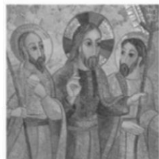
CATÉCHÈSE POUR ADULTES