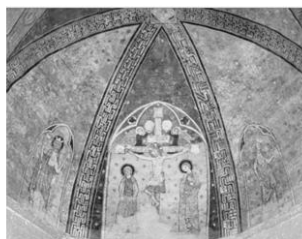
DIOCÈSE DE POITIERS: Peintures murales, 30 ans de découvertes

Collégiale St-Pierre de Chauvigny du 10 juin au 12 juillet 2023